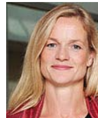
Viola von Cramon, Grüne, Mitglied des Bundestages Mitglied des Sportausschusses (Bund)